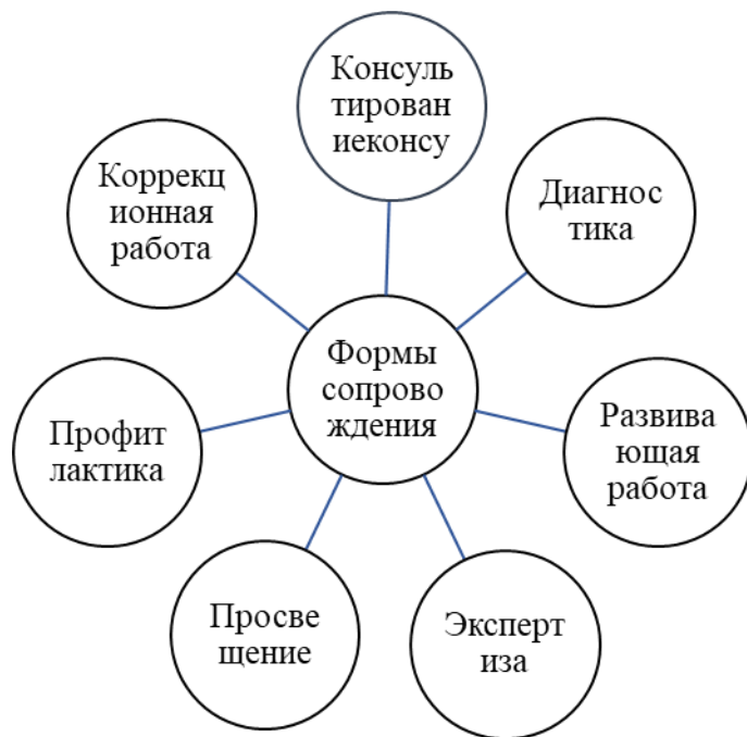
Схема 1. Формы психолого- педагогического сопровождения в Школе- интернате № 23 ОАО «РДЖ» Психолого-педагогическое сопровождение позволяет сохранять и развивать достоинства личности, организовать взаимодействие педагога и родителя по выявлению и анализу реальных или потенциальных личностных проблем у родителя, совместному проектированию возможного выхода