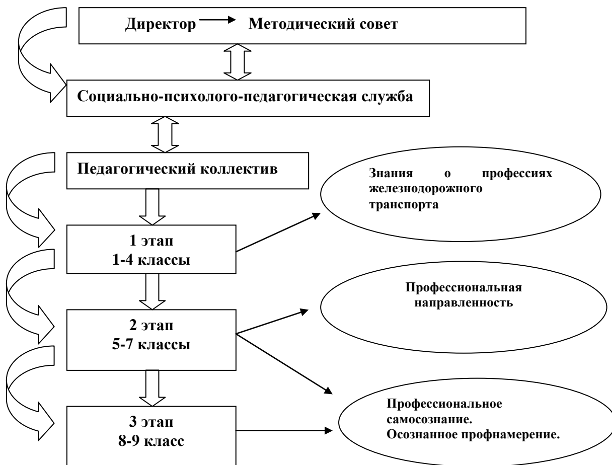
Рис. 4 Этапы профориентационной работы