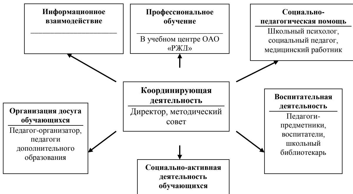
Рис. 2. Система обеспечения профессионального самоопределения обучающихся в НОУ «Школа-интернат № 24»

Система работы по профессиональному самоопределению обучающихся, в которую включены практически все педагоги, воспитатели школы-интерната, сами обучающиеся и их родители, представлена на рисунках 2-4.