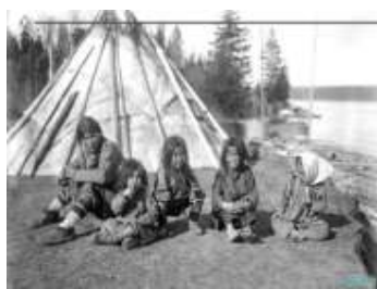
1 – чум тофаларов

5. Что можно рассказать об образе жизни людей, судя только по типу их жилья? – жилье может подсказать, кочевники это или оседлые, охотники или скотоводы; об уровне развития ремесел (выделка шкур, войлока)