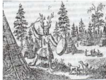
3 – чум эвенков

2) Задание по карте «Народы Сибири в XVI-XVII в.в.» (Приложение 1.1). По условным обозначениям определите, к каким языковым группам они относятся. Предложите варианты ответов, почему относятся не к одной языковой группе.