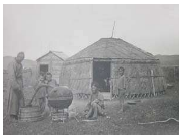
2 – юрта бурят